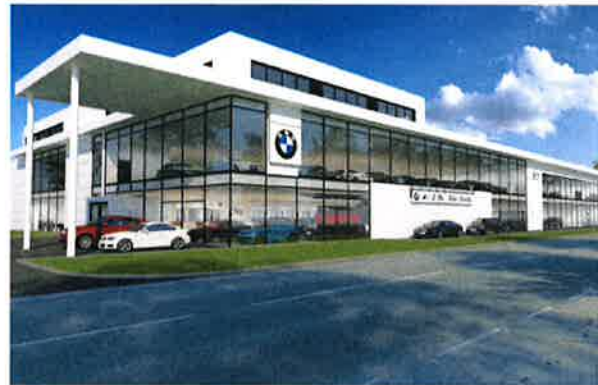
Les nouvelles installations seront situées rue Christophe Plantin.

Après les locaux de Bonnevoie, propriété de la famille Kontz et bâtis dans les années 70, place d'ici début 2022 à un lieu de travail de 11.500 mètres carrés au sol, quatre étages et demi, et deux parkings de 420 places au total.