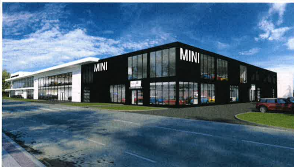
Aperçu de la future concession.

Le site en question est situé à la Cloche d'Or, rue Christophe Plantin, dans des bâtiments qu'occupait auparavant le groupe Elco, spécialisé dans l'électricité et les techniques du bâtiment. Il sera loué au moins pour 15 ans par Bilia-Emond.